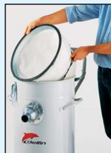
Doppio filtro (poliestere + nylon) per polveri Self-cleaning double dust filter (nylon + polyester)