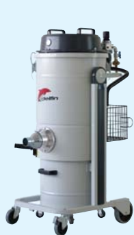
Mistral 352 DS AIR EX