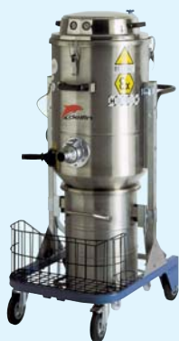
DM3 AIR EX

Filtro assoluto Absolute filter Optional 99,999% DOP