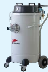
Mistral 802 WD AIR