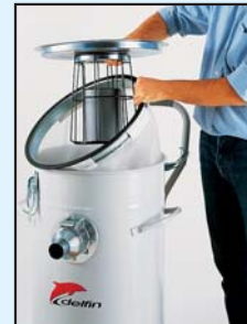
Filtri per liquidi in polipropilene e fibra con galleggiante Polypropylene and fibre filter for liquids, with floating device